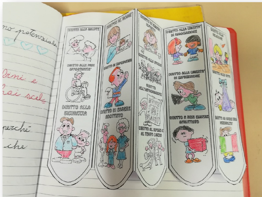
Pieghevole incollato sul quaderno con alcuni dei diritti dei bambini

In una seconda lezione i bambini sono stati invitati a riflettere sui singoli diritti (alcuni). Anche per quest'anno sono stati rappresentati graficamente con dei disegni che ogni bambino ha colorato, ritagliato, piegato e incollato sul quaderno. Individualmente, hanno scelto uno dei diritti che secondo loro era più importante e in un primo momento ne hanno condiviso l'idea con i compagni, successivamente hanno motivato la loro scelta scrivendola sul quaderno.