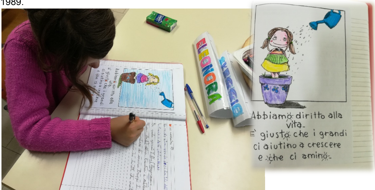
Introduzione all'argomento trattato

Quest'anno, in 4 a , si è puntato maggiormente sull'aspetto storico e sulle motivazioni che hanno portato a stilare una Convenzione delle Nazioni Unite sui diritti del Fanciullo nel 1989.